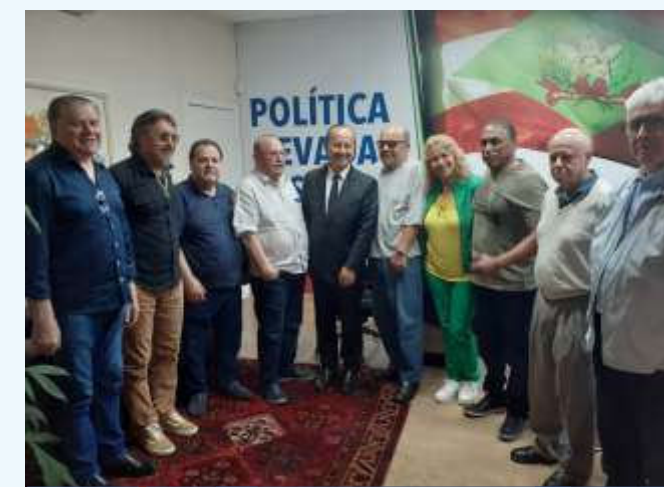
Comissão AAPFUSESC e PROBESC com o Senador Jorginho Mello